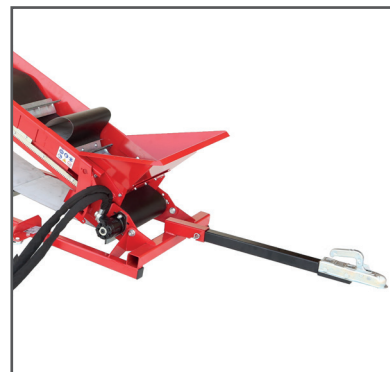
Deichsel mit Anhängerkupplung

Förderband TMB E5 , Elektrischer Antrieb 230 V