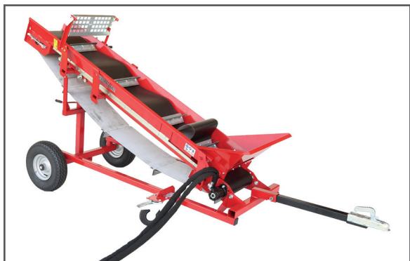
Förderband mit Höheneinstellungsstütze und Trichter